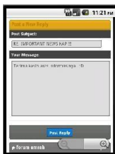
Gambar 2.4. Post replay dari platform

Proses dimana pengguna melakukan posting thread kedalam forum, dengan mengisi subjek dan isi pesan posting .