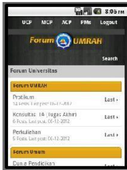
Gambar 2.2. Home Forum dari platform Android

penginstalan di forum myBB berupa konversi ke perangkat mobile berupa plugin gomobile, kemudian di design plugin tersebut sesuai kebutuhan seperti yang ditampilkan gambar berikut