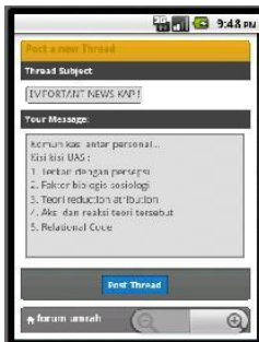
Gambar 2.3. Post thread dari platform Android

Halaman ini sebagai halaman home dari forum online bulletin board .